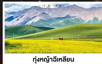
ทุ่งหญ้าจีเหลียน